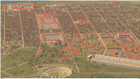
Trier im 4. Jahrhundert n. Chr.

Jeder kennt doch das Sprichwort „Alle Wege führen nach Rom“, aber stimmt das wirklich? Eine Reisegruppe macht eine große Reise durch die Metropolen der Antike. Nachdem sie sich schon Städte wie Alexandria, Athen und Pompeji angeguckt hat, wollen sie ihre Reise im kleinen Rom „Augusta Treverorum“, das später „Trieris“ heißt, abschließen. Doch die Gruppe hat Probleme sich im Straßennetz der Römer zurecht zu finden. Kannst du ihnen helfen den richtigen Weg nach Trier einzuschlagen?