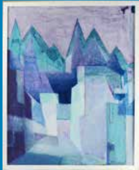
Sieh um dich V, Heinrich Feld, 2000