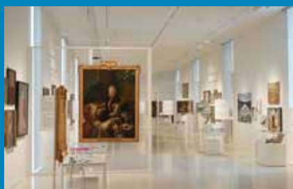
Blick in die Sonderausstellung „Tell Me More. Bilder erzählen Geschichten“