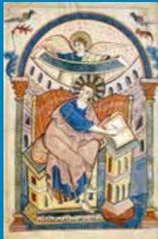
Miniatur aus dem Ada Evangeliar: Evangelist Matthäus