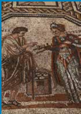
Musenmosaik im Rheinischen Landesmuseum Trier.