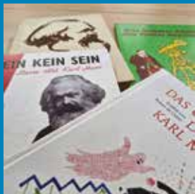
Karl Marx im Kinderbuch