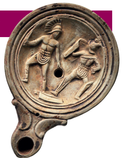
Hier zie je een Romeins 'fanartikel', een olielamp met gladiatoren.