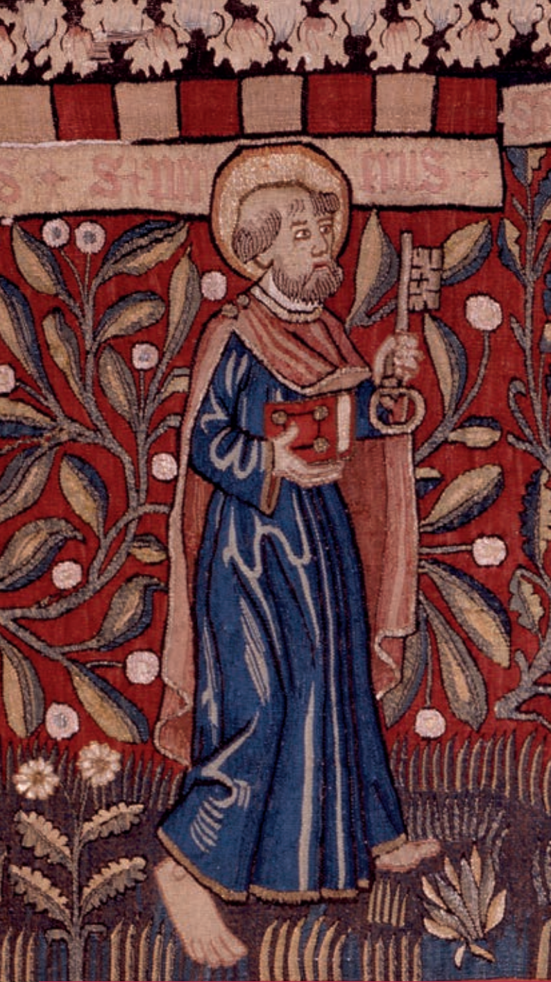
Ein spätgotischer Bildteppich in der Dauerausstellung zeigt Christus mit den zwölf Aposteln, darunter den heiligen Petrus, Stadtpatron von Trier.